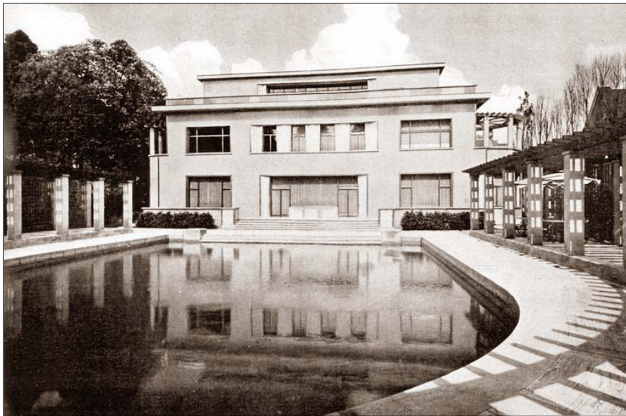
Villa Empain in 1935

In de voorgaande Art Deco cursus hebben we onze inspiratie gehaald uit fraai uitgegeven boeken. Dit seizoen willen we echter starten in Villa Empain, een onlangs geopend Art Deco gebouw in Brussel.