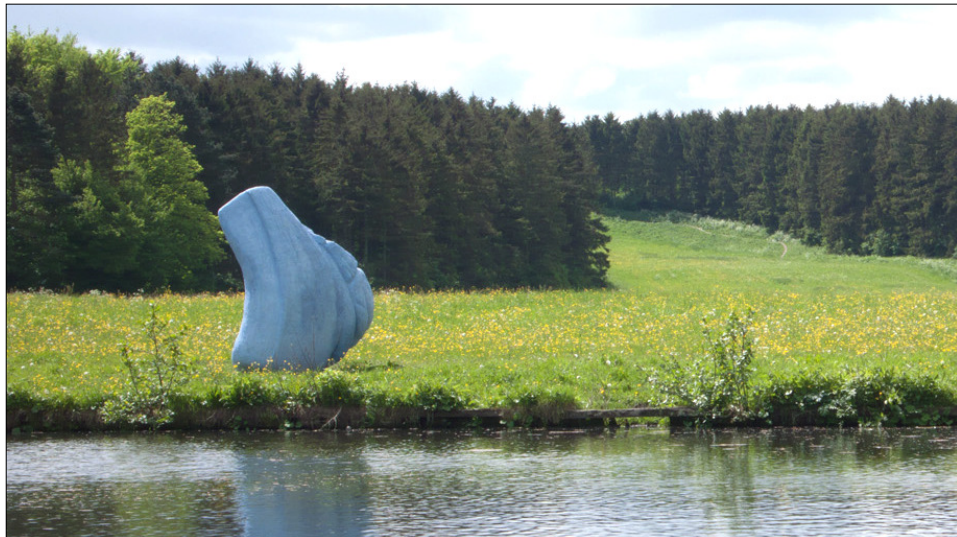
'Blauwe Zee' in het Amsterdamse Bos

De expositie bij Clement is succesvol verlopen. Dat kan tevens gezegd worden over afgelopen voorjaar 2012. Nu is 't de uitdaging haar collectie met nieuw werk aan te vullen.