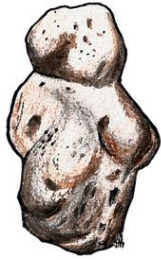
Berekhat Ram bekende voorbeeld van figuratieve kunst.

een mens is bewerkt, ook al lijkt het niet erg op de latere Venus beeldjes van het laat-paleolithicum. Omdat het is gevonden tussen twee aslagen kon worden bepaald dat het minimaal 230.000 jaar oud is. Daarmee is dit nu het oudst