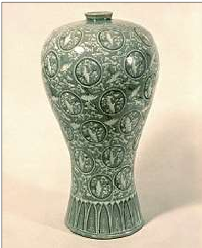
Maebyeong celadon vaas met sanggam gegraveerde kraanvogels (National Treasure No. 68)

Opvallend voor de hele tijdlijn (vanaf de prehistorie) is de ontwikkeling van de Koreaanse 'ruwe keramiek' naar de uiterst verfijnde celadons uit de 12 e eeuw. Zelfs verfijnder dan de Chinese keramiek uit diezelfde tijd. De Chinezen benoemden het Koreaanse keramiek 'het beste onder de hemel'. Vondsten tonen late Koreaanse celadons met rode