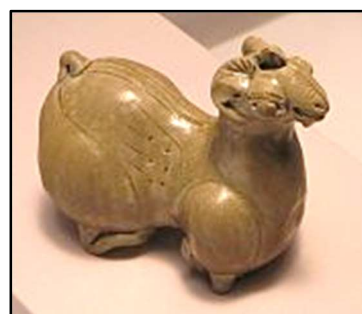
Schaap, vroeg celadon, 3 e -4 e eeuw na Chr

Silla was een Koreaans koninkrijk. Uitgegroeid van een stadsstaat (57 voor Chr.) tot één van de drie koninkrijken op dit grote schiereiland. Met de vereniging van “de Drie Koninkrijken” tot één rijk door Silla (668